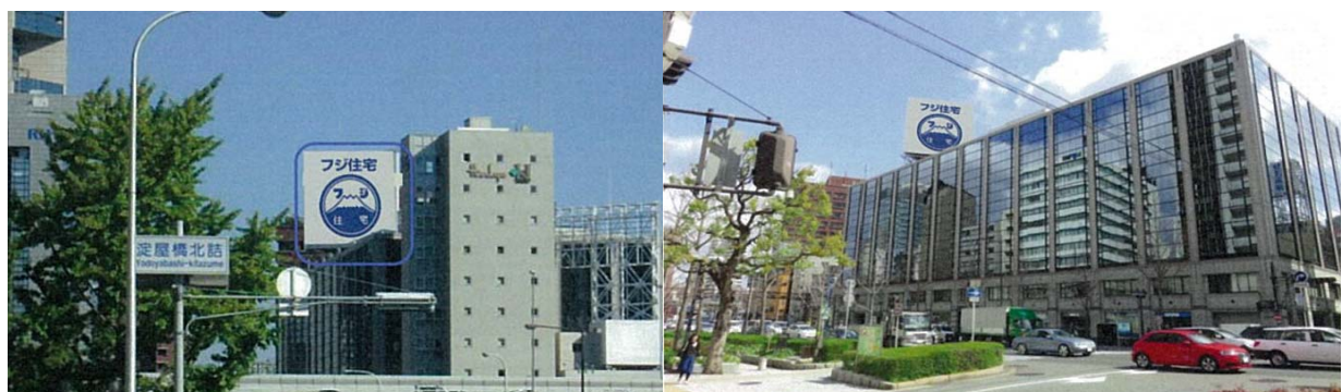
夜間ライトアップイメージ