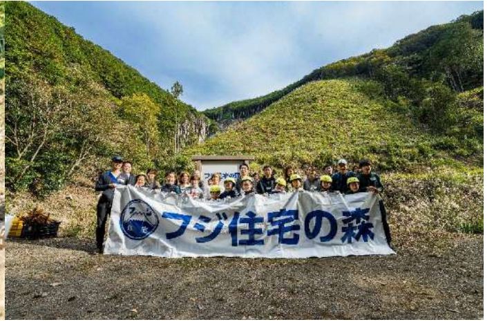
和歌山県日高川町『フジ住宅の森』 ハイキングと植樹活動