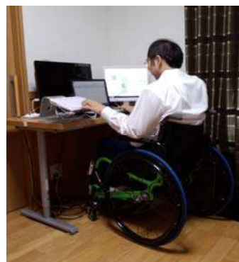
遠距離在宅勤務風景 (茨城県銚田市)

当社は引き続き、投資家の皆さまのご期待に応えるべく、企業価値の向上に努めて参る所存です。今後とも、ご支援賜りますようお願い申し上げます。