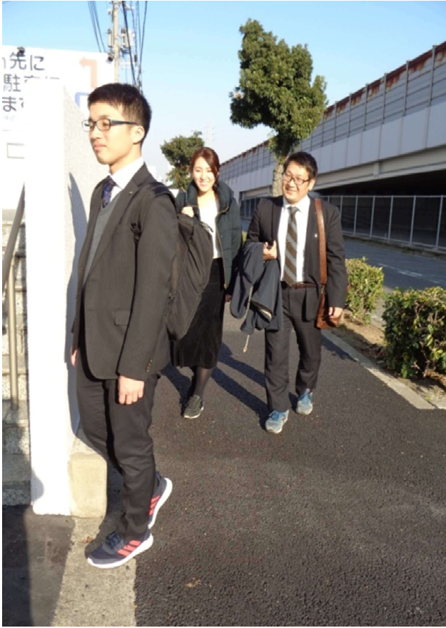
【スニーカー通勤風景】