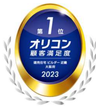
2023年 オリコン顧客満足度*調査 建売住宅ビルダー 近畿 大阪府 第1位