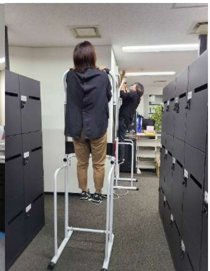
社内でのぶら下がり健康器具使用風景