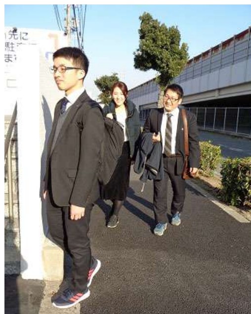
「スニーカー通勤」風景