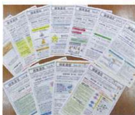
健康に関連する資料の全社回覧「健康通信」