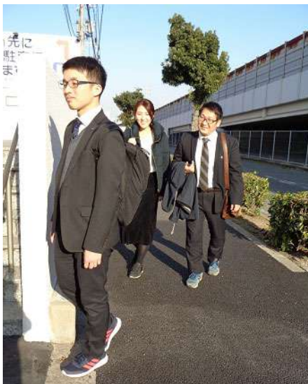
「スニーカー通勤」 風景