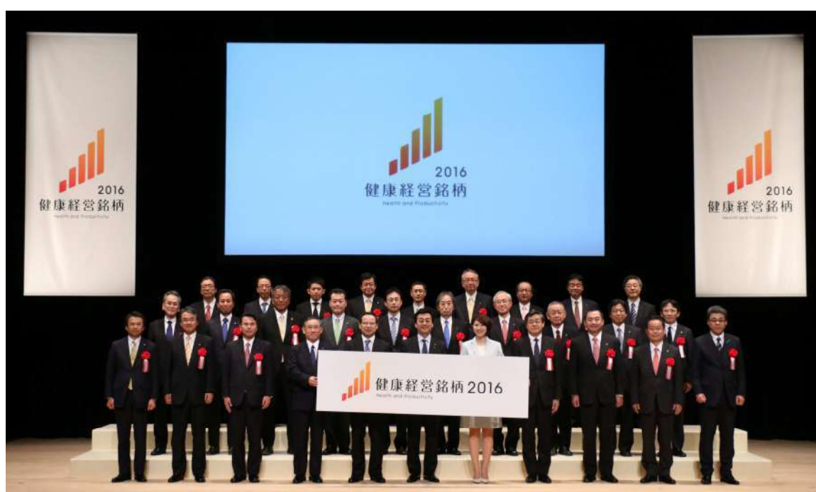
平成 28 年 1 月 21 日 発表会（イイノホールにて）