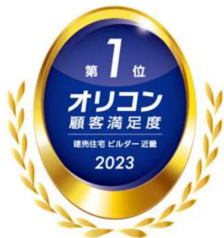
2023年 オリコン顧客満足度*調査 建売住宅ビルダー 近畿 第1位

今後も、顧客満足度No. 1のフジ住宅として、お客様の信頼を裏切ることのない、安心と信頼の住まいづくりをご提供して参ります。