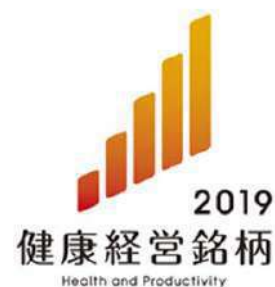
平成31年2月21日 発表会（イイノホールにて）