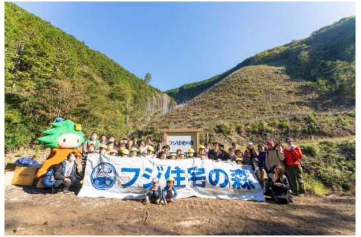
【和歌山県日高川町『フジ住宅の森』植樹活動】