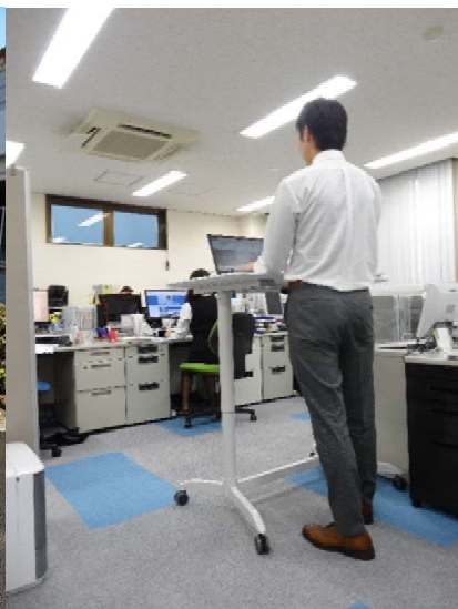
昇降式デスクでの仕事風景