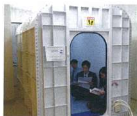
就業中に酸素BOXを利用し、いつでもリラックスできる環境を整備

経営トップらが社員一人ひとりに個別対応する質問会を定期的で開催。業務上の困りごとや家庭での悩みの解決に時間をかけて向き合い、従業員の精神的なケアにつなげている。