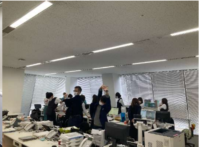
「3時のストレッチ」 風景