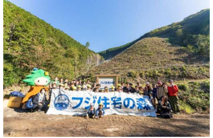
和歌山県日高川町『フジ住宅の森』 ハイキングと植樹活動