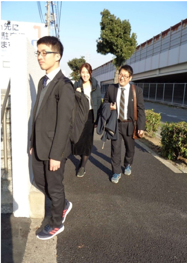
【スニーカー通勤風景】