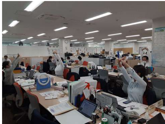
「3時のストレッチ」 風景