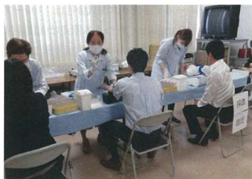
社内実施の健診の様子

経営トップが健康づくりの重要性を全社員に発信し、社員一人ひとりに向き合いメンタルケアに携わるなど積極的に関与。産業医や保健師と連携した施策実行に加え、次年度からは健保組合との連携体制強化を目指しています。全社員参加による取り組みを展開するほか、健診や専門スタッフによる健康相談の充実化にも力を入れています。